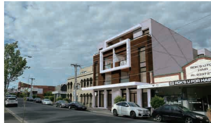
Rose Street, Essendon 81-91 Rose Street, Essendon