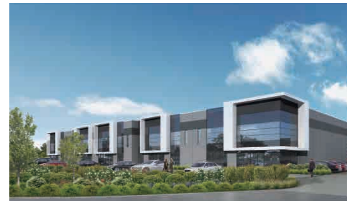
Braeside Industrial Estate — Warehouse / Service Station 260-280 Governor Road, Braeside