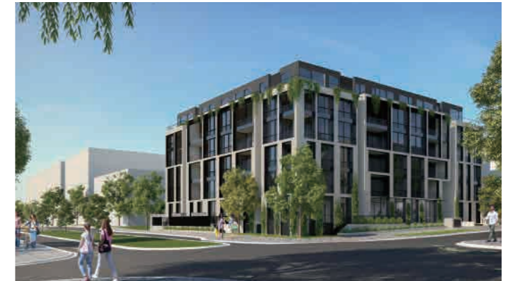
Oakleigh on Drummond 102-108 Drummond Street, Oakleigh