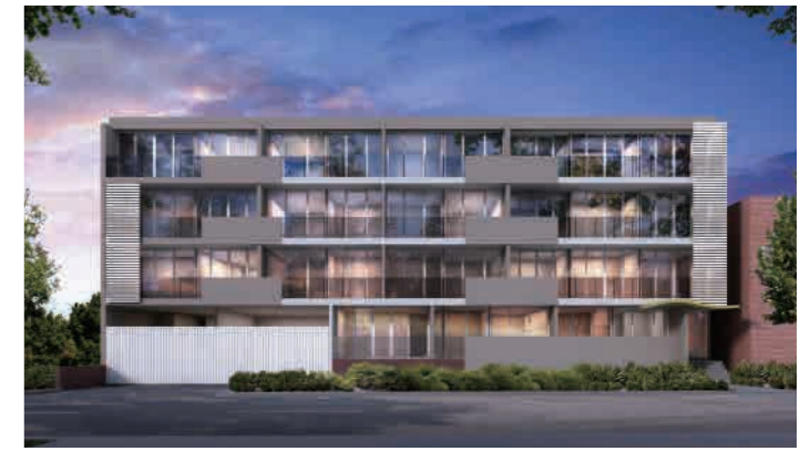
Fairfield on the Park 262-268 Heidelberg Road, Fairfield