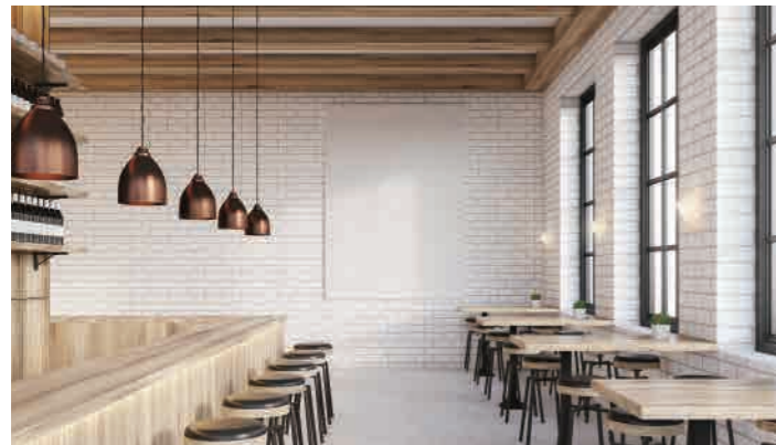
Le Festin Cafe Retail Shop, 35-43 Dryburgh Street, West Melbourne