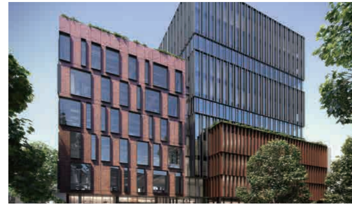
GCQ Collingwood 71-93 Gipps Street, Collingwood