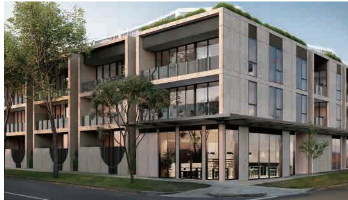
Pure Hampton 23-31 Small Street, Hampton