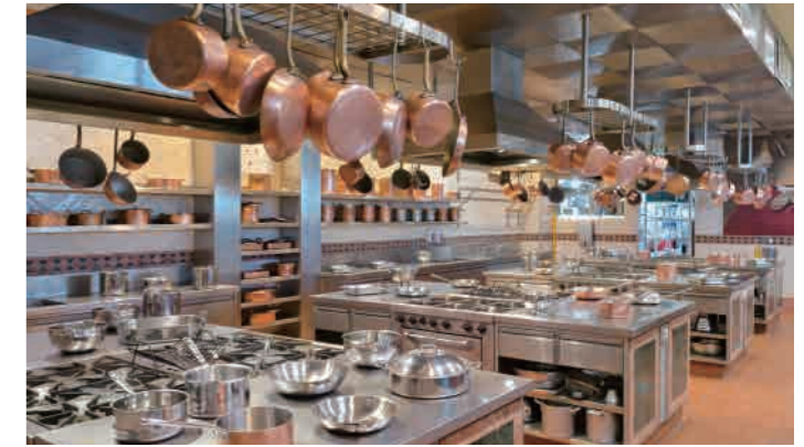
Melbourne Village Cooking School B2, 377 Spencer Street, West Melbourne