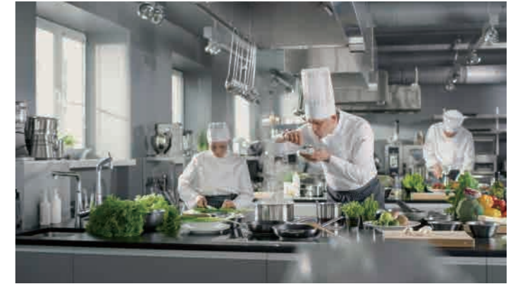
Bond Quarter Cooking School R1 & R2, 386-392 Spencer Street, West Melbourne