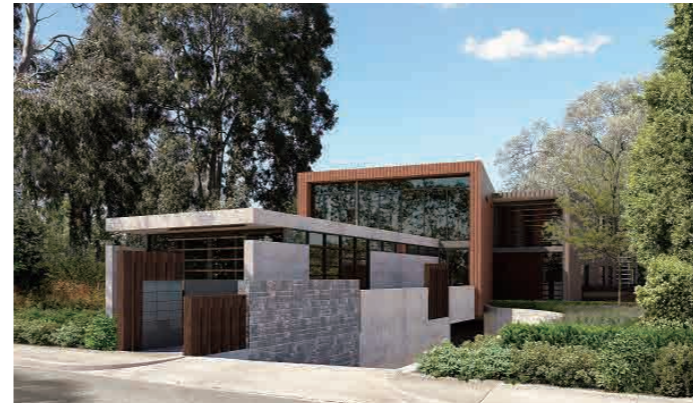
Alphington on the River 1-3 Rex Avenue, Alphington