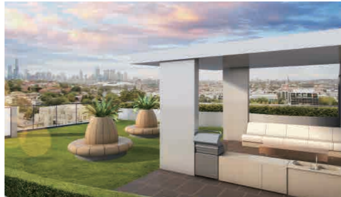
Prime Tower 47 Claremont Street, South Yarra