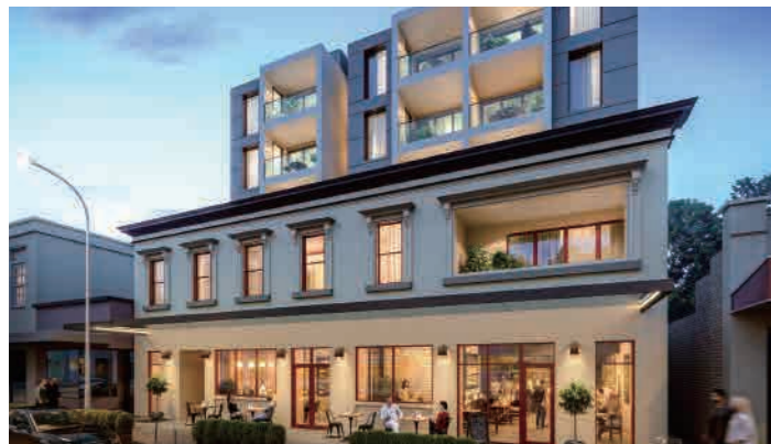
Crest 611 Sydney Rd, Brunswick