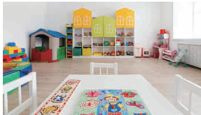
Sunbury Village Childcare 1-17 Obeid drive, Sunbury