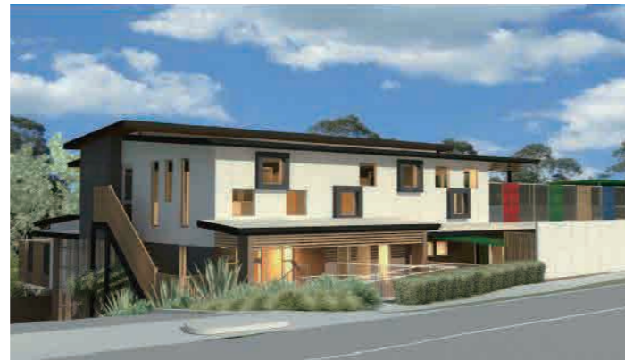
Bulleen ELC 54-58 Thompsons Rd, Bulleen