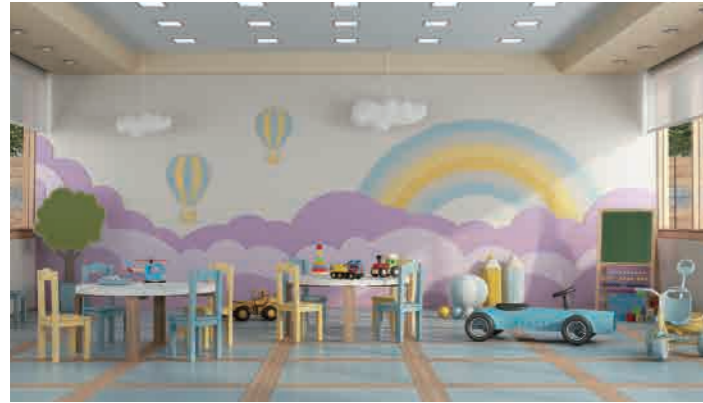
Chadstone Childcare Development 427 Huntingdale Road, Chadstone