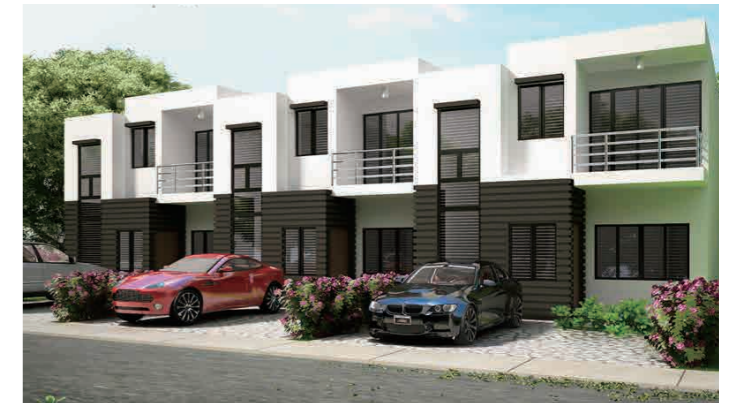
Vineyard Sunbury 1-17 Obeid Drive, Sunbury