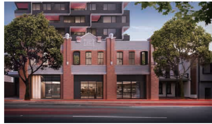
Bond Quarter 386-392 Spencer St, West Melbourne