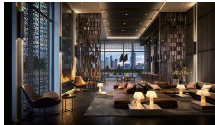
Buckhurst St 11-43 Buckhurst Street, South Melbourne