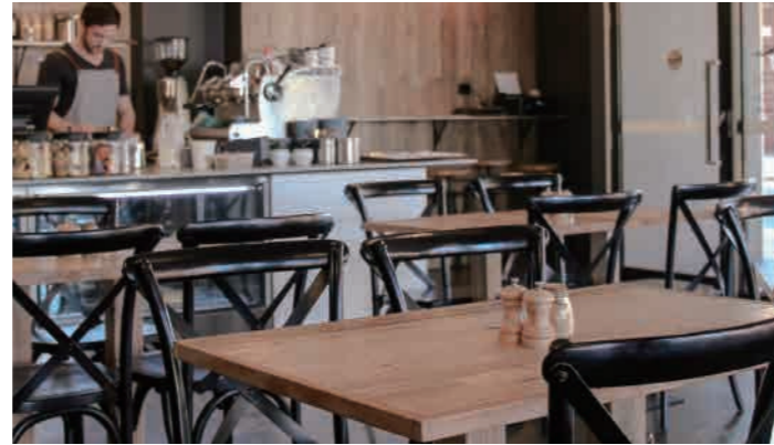
Little Peacock Cafe Retail Shop, 10-14 Hope Street, Brunswick