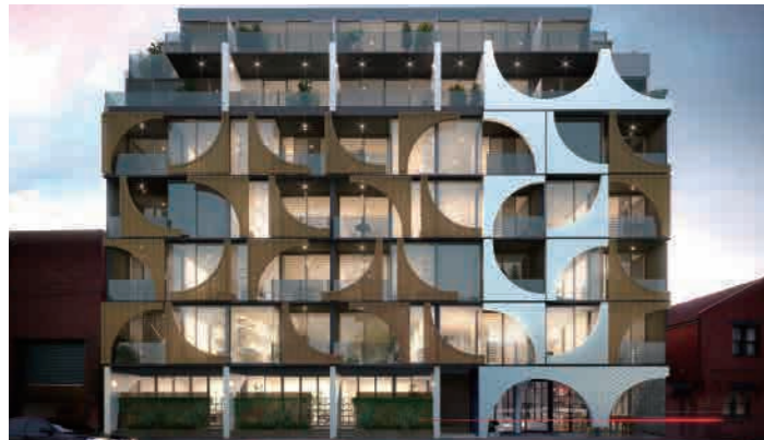
The Wallace 35-43 Dryburgh Street, West Melbourne