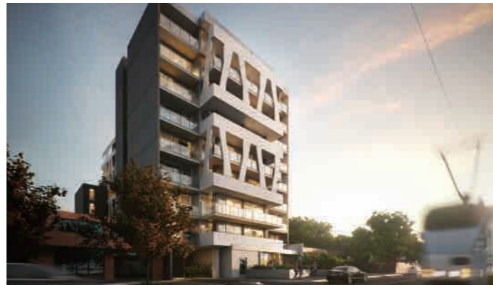
33-North 33-39 Racecourse Road, North Melbourne