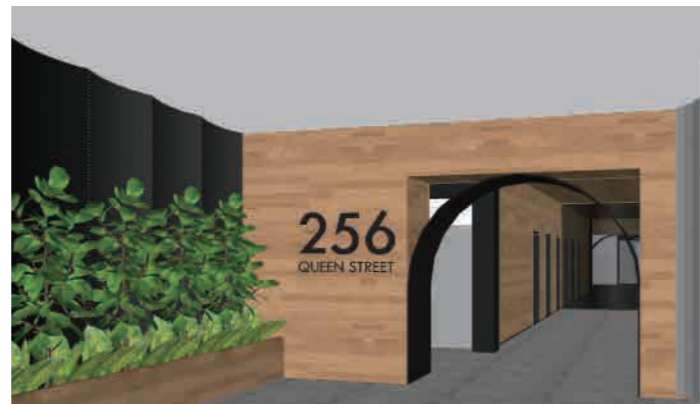
Office Building Renovation 256 Queen Street, Melbourne