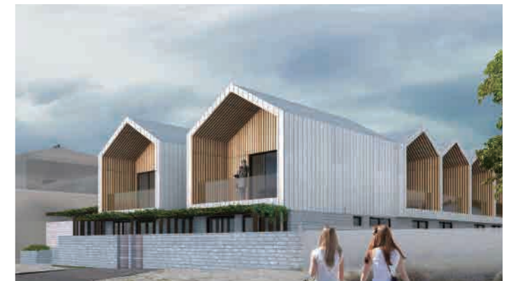
Epsom & Main 526-528 Main Street, Mordialloc