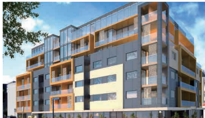
B Brunswick 10-14 Hope Street, Brunswick