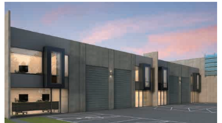
Preston 22-28 Swanston Street, Preston